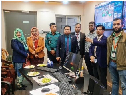
Figure 5: তথ্য ও যোগাযোগ প্রযুক্তি বিভাগের মধ্যবর্তী মূল্যায়ন কমিটি কর্তৃক কোতোয়ালী মডেল থানায় স্থাপিত আইপি ক্যামেরা ভিত্তিক সার্ভেল্যান্স সিস্টেম পরিদর্শন