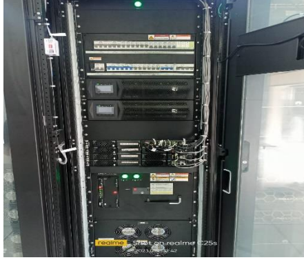
Figure 3: সার্ভার কম্পিউটার