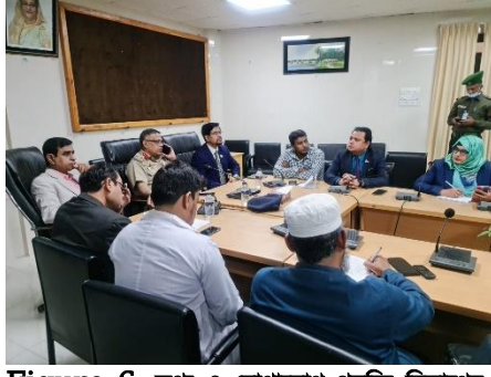
Figure 6: তথ্য ও যোগাযোগ প্রযুক্তি বিভাগের মধ্যবর্তী মূল্যায়ন কমিটির সাথে সিলেট এম এ জি ওসমানী মেডিকেল কলেজ হাসপাতালে কর্তৃপক্ষের মতবিনিময়