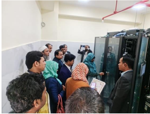
Figure 4: তথ্য ও যোগাযোগ প্রযুক্তি বিভাগের মধ্যবর্তী মূল্যায়ন কমিটি কর্তৃক সিলেট এম এ জি ওসমানী মেডিকেল কলেজ হাসপাতালে স্থাপিত মডিউলার ডাটাসেন্টার পরিদর্শন