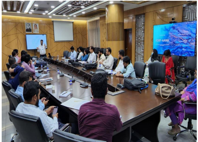
Figure 7: প্রশিক্ষণ কার্যক্রম