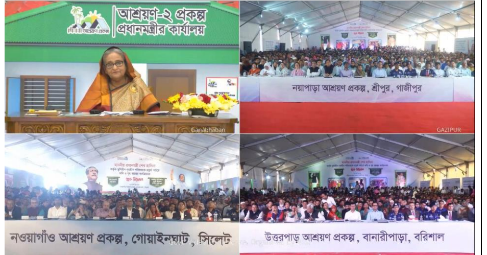
Figure 13: ভিডিও কনফারেন্স এর মাধ্যমে মাননীয় প্রধানমন্ত্রী কর্তৃক আশ্রয়ণ-২ প্রকল্পের গৃহ হস্তান্তর কার্যক্রমের উদ্বোধন অনুষ্ঠান।