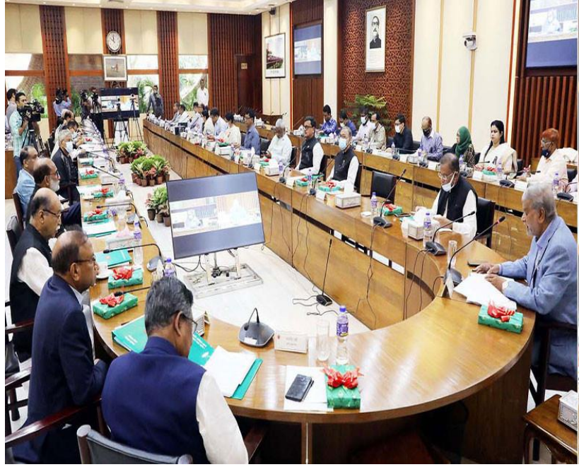
Figure 6: ভিডিও কনফারেন্স এর মাধ্যমে মাননীয় প্রধানমন্ত্রীর একনেক সভায় অংশগ্রহণ