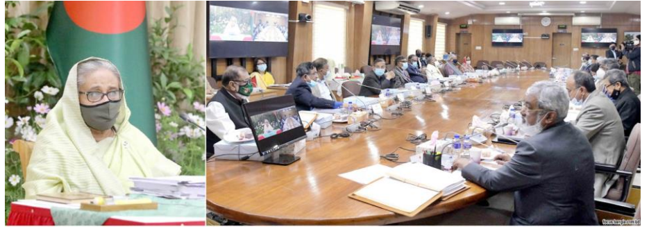
Figure 4: ভিডিও কনফারেন্স এর মাধ্যমে মাননীয় প্রধানমন্ত্রীর মন্ত্রিপরিষদ সভায় অংশগ্রহণ