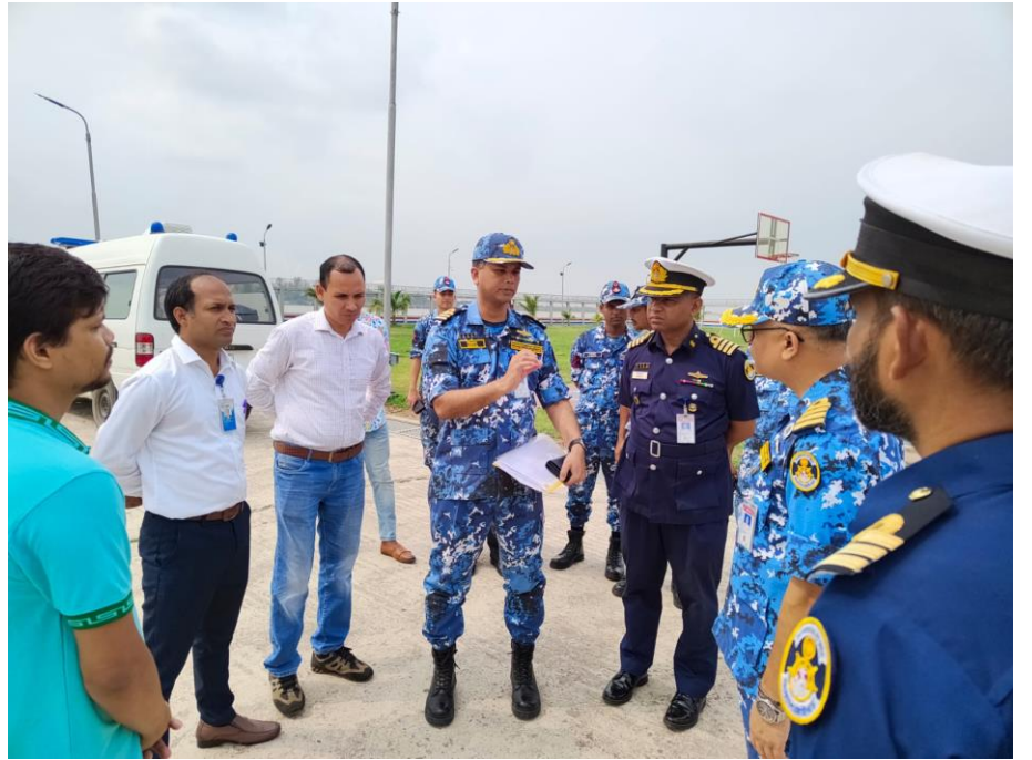
Figure 10: মাননীয় প্রধানমন্ত্রীর ভিডিও কনফারেন্স এর নেটওয়ার্ক কানেক্টিভিটি স্থাপনের জন্য সাইট সার্ভে কার্যক্রম