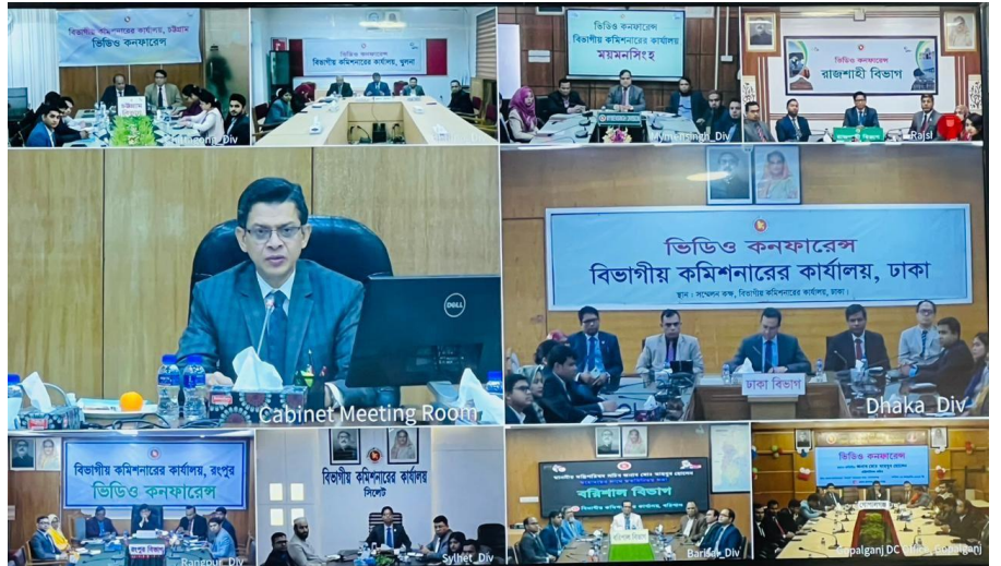
Figure 5: ভিডিও কনফারেন্স এর মাধ্যমে মন্ত্রিপরিষদ বিভাগ হতে সকল বিভাগীয় কমিশনারগণের সাথে মতবিনিময়