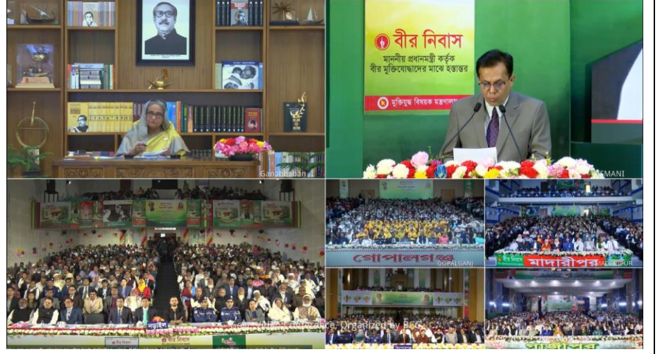
Figure 12: ভিডিও কনফারেন্স এর মাধ্যমে মাননীয় প্রধানমন্ত্রী কর্তৃক "অসচ্ছল বীর মুক্তিযোদ্ধাদের জন্য আবাসন নির্মাণ প্রকল্পের আওতায় নির্মিত 'বীর নিবাস' বীর মুক্তিযোদ্ধাদের মাঝে হস্তান্তর কার্যক্রম উদ্বোধন অনুষ্ঠান।