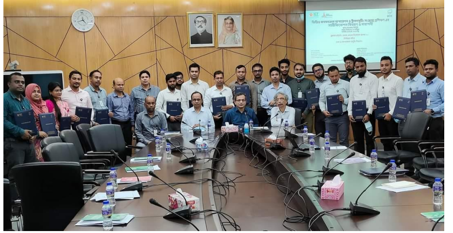
Figure 9: প্রশিক্ষণ ব্যাচ-১ সমাপনী অনুষ্ঠান এবং সার্টিফিকেট বিতরণ