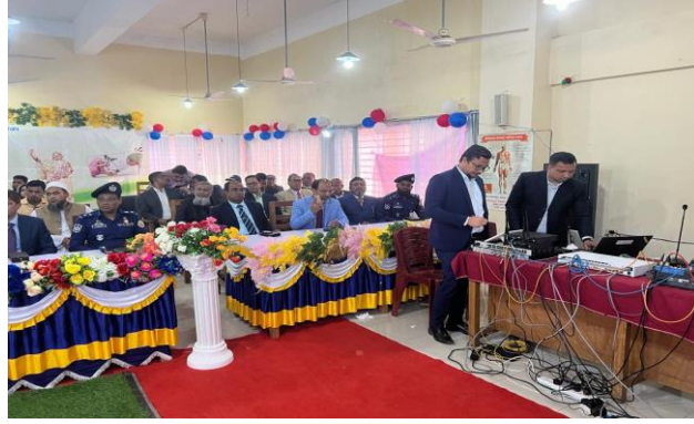
Figure 3: মাননীয় প্রধানমন্ত্রীর ভিডিও কনফারেন্স এর পূর্ব প্রস্তুতি