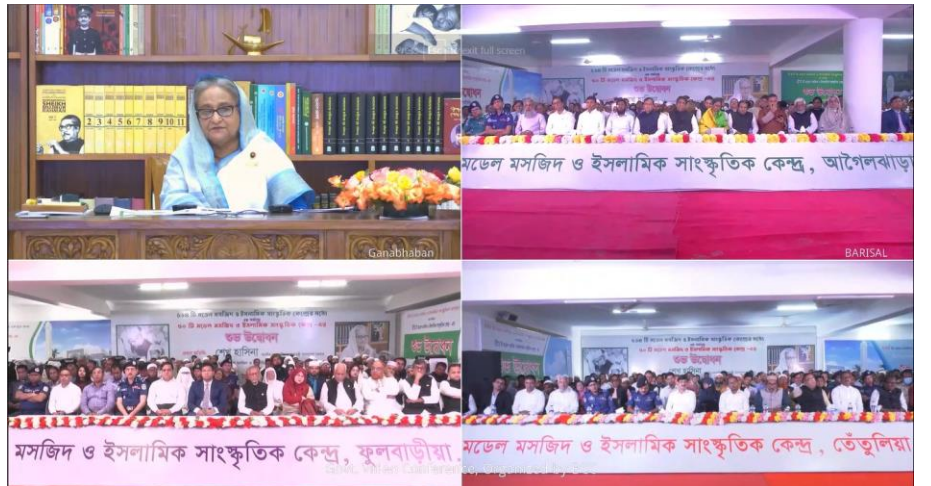
Figure 11: ভিডিও কনফারেন্স এর মাধ্যমে মাননীয় প্রধানমন্ত্রী কর্তৃক দেশের নবনির্মিত ৫০ টি মডেল মসজিদ ও ইসলামিক সাংস্কৃতিক কেন্দ্রের উদ্বোধন অনুষ্ঠান।