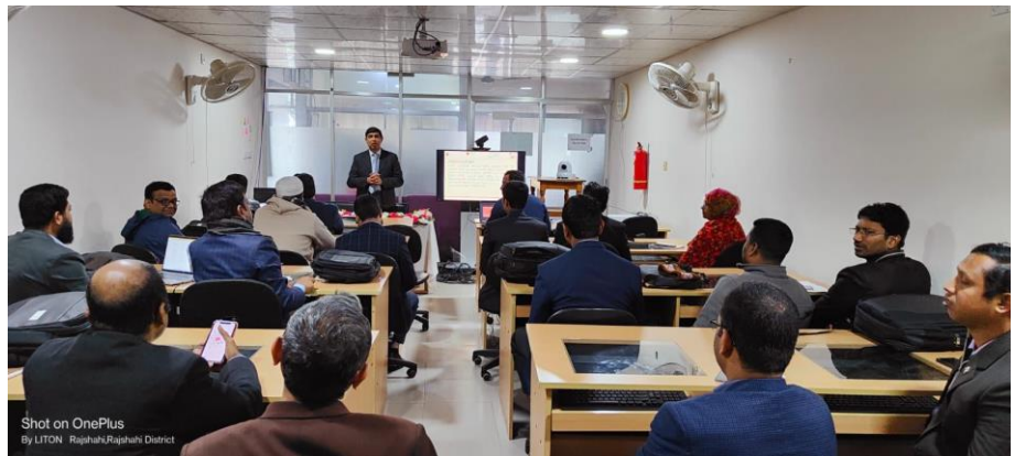
Figure 8: বিসিসি'র আঞ্চলিক কার্যালয়ে অনুষ্ঠিত প্রশিক্ষণ কার্যক্রম