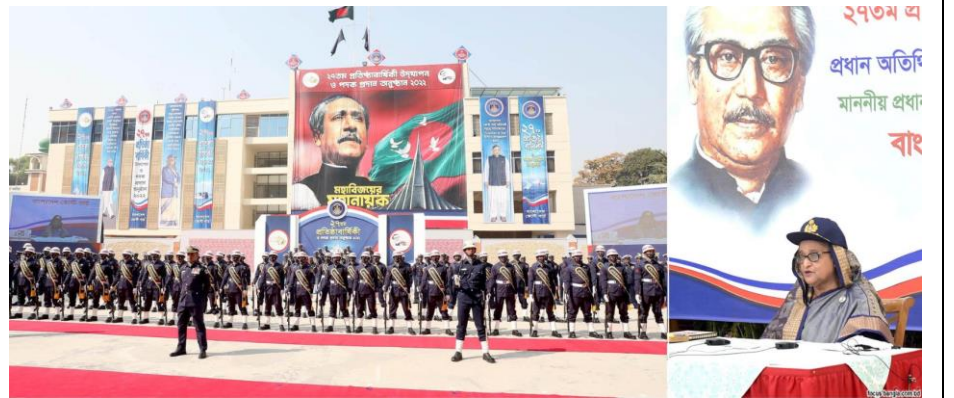
Figure 14: ভিডিও কনফারেন্স এর মাধ্যমে মাননীয় প্রধানমন্ত্রীর বাংলাদেশ কোস্ট গার্ডের ২৭তম প্রতিষ্ঠা বার্ষিকী অনুষ্ঠানে অংশগ্রহণ।